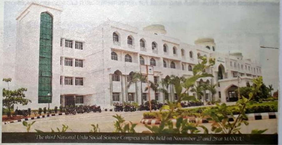
The third National Urdu Social Science Congress will be held on November 27 and 28 at MANUU.

For further details, contact on phone numbers 040-23008327, 9490377817, 9502044291; email: nussemanuu@gmail.com .